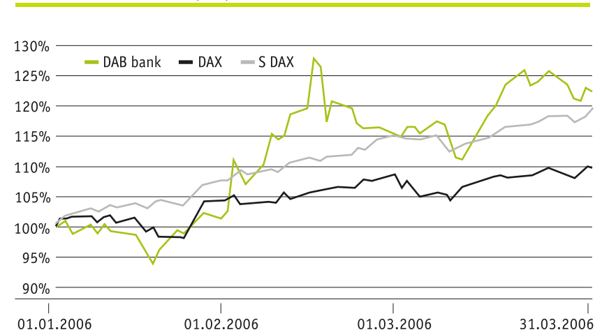
Kursverlauf der DAB bank Aktie, DAX, SDAX

Während die Kurse an den deutschen Börsenmärkten, insbesondere getragen durch die Aussichten auf eine anziehende Konjunktur, stetig nach oben gingen, blieben sie in den USA merklich dahinter zurück. Die Erhöhung der Zinsen auf 4,75 Prozent durch die US Notenbank unter ihrem neuen Chef Ben Bernanke sorgte im ersten Quartal für Zurückhaltung bei Anlegern. Der Dow Jones beendete das Quartal mit einem Zuwachs von nur 3,7 Prozent bei 11.109,32 Punkten, der Technologieindex Nasdaq zog im ersten Quartal leicht von 1.645,20 auf 1.703,66 Punkte an. Etwas besser als die amerikanischen Indizes, aber schlechter als die deutschen, entwickelte sich der Nikkei: Im ersten Quartal legte er um 5,9 Prozent auf 17.059,66 Punkte zu.