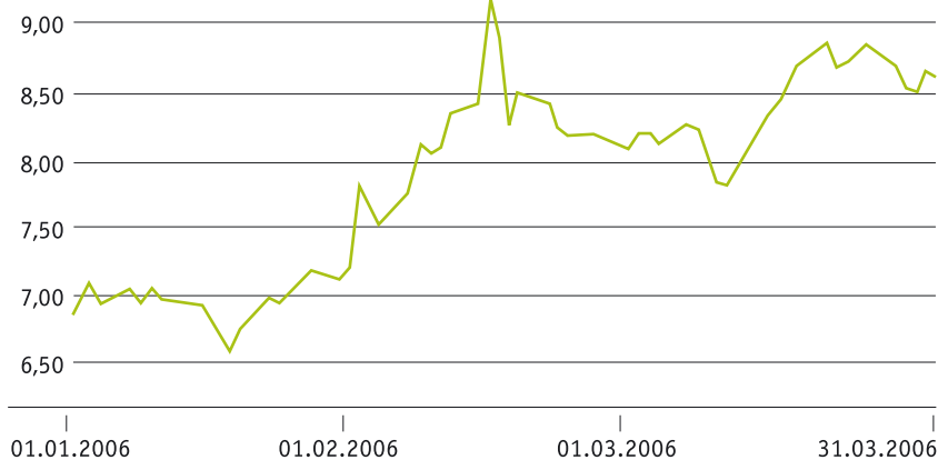
Wertentwicklung der DAB bank Aktie in Euro

Die Strategie der DAB bank ist auf profitables Wachstum und die nachhaltige Steigerung des Unternehmenswerts ausgerichtet. Durch kontinuierlichen Dialog mit all unseren Stakeholdern kommunizierten wir auch im ersten Quartal diese Ziele: Am 14. März stellten wir unsere Ergebnisse für das Geschäftsjahr 2005 auf zwei Konferenzen für Journalisten und Analysten in Frankfurt vor. Darüber hinaus führten wir Roadshows in den USA, Paris und London durch.